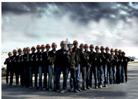
СТУДЕНЧЕСКИЕ ОТРЯДЫ СТР. 3