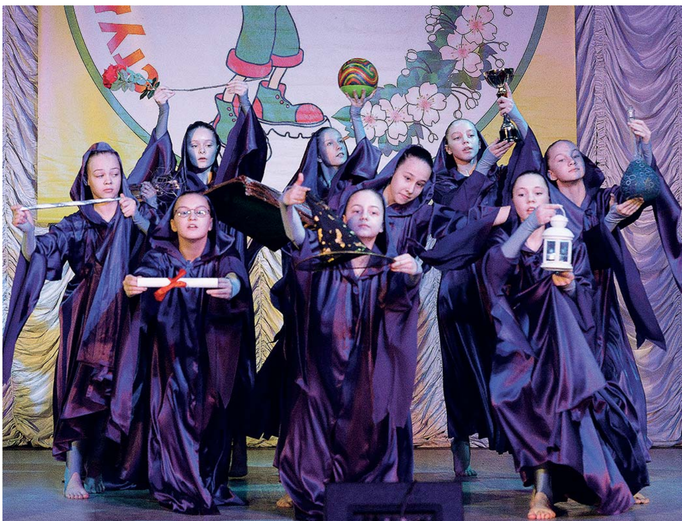
Студенческая весна – 2016 стр. 6